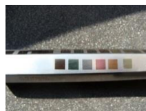
OP Besteck, Edelstahl, Anlauffarben