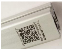
Alu schwarz, unter dem Eloxal